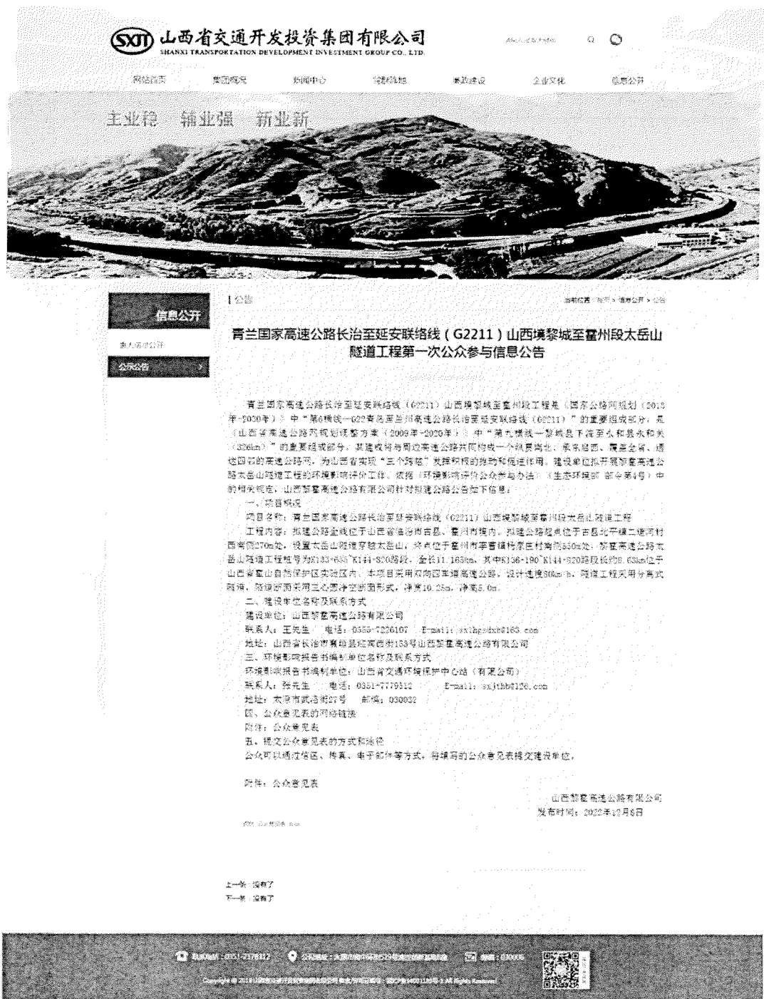
图 1 网络平台环评信息首次公开